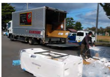
大型トラックから荷卸し